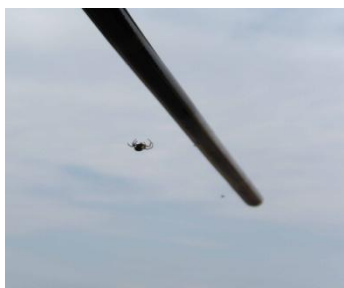
Spidsen af et Draken fly

Koster det spidsen af en jetjager at sikre bygninger mod indtrængende vand?