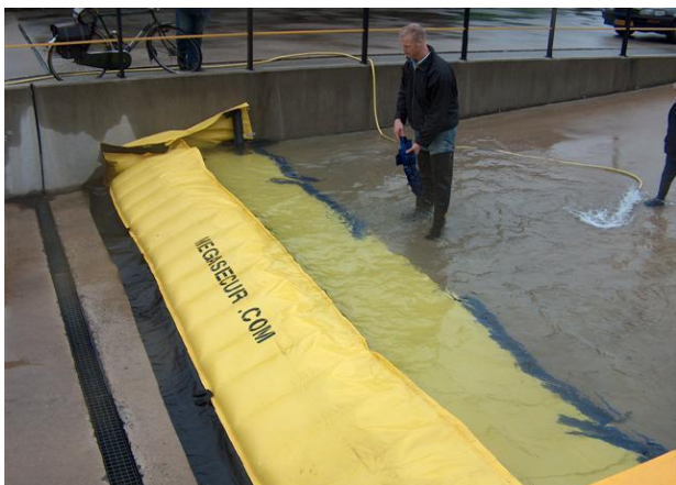
Water Gate udlagt i nedkørsel til en parkeringskælder