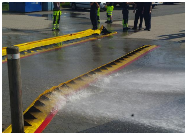
Test af Water Gate hos beredskabet i Greve.